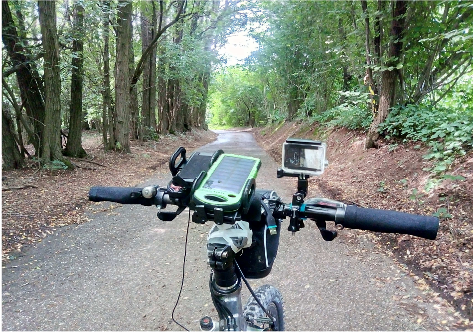
Verso la fine della discesa sulla nostra sinistra un capitello votivo