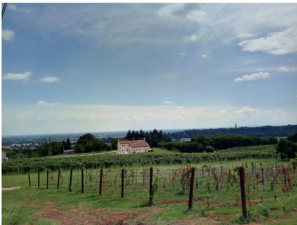
(La pianura trevigiana)