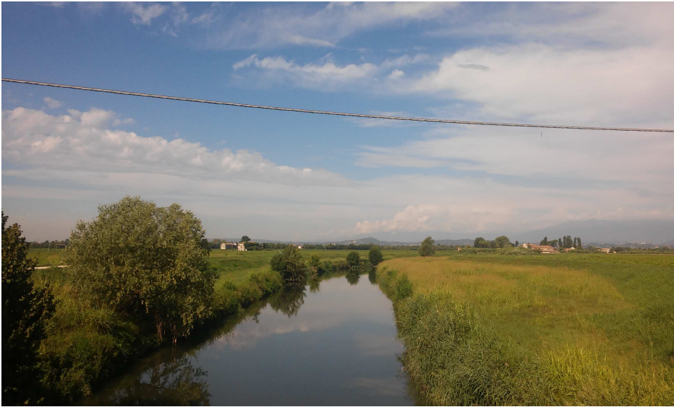
( dal Ponte di via Chilo )

Pedalato così per circa 2,7 km teniamo la destra e attraversiamo un nuovo ponte. Siamo in via del Chilo.