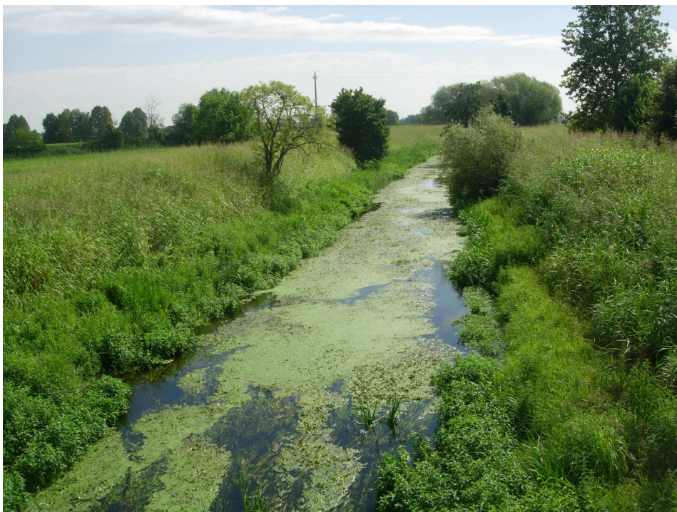
( il canale Faver )

Proseguiamo ancora per altri 400 metri. Siamo oramai a Visnà!